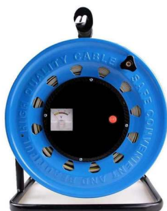
Vízszintmér? kék fém dobon